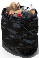
Ordures Ménagères (sacs noirs)

Tous les déchets collectés par les Services Publics de Gestion des Déchets