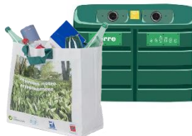
Collecte Sélective (sacs jaunes, verre)